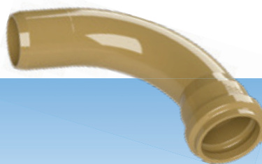
CURVA LONGA 90° - PB