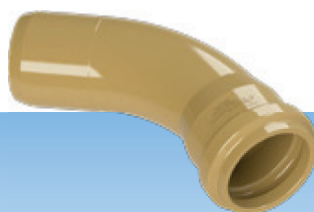
CURVA LONGA 45° - PB