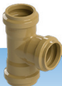
TÊ - BBB

O Sistema de Adução e Distribuição de água PBA , são fabricados conforme ABNT NBR 5647, na cor marrom, com classe de pressão PN 1,00 Mpa (CL 20) e dimensionados à trabalharem enterrados com Junta com Anel Toroidal.