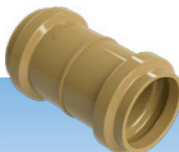
LUVA DE CORRER