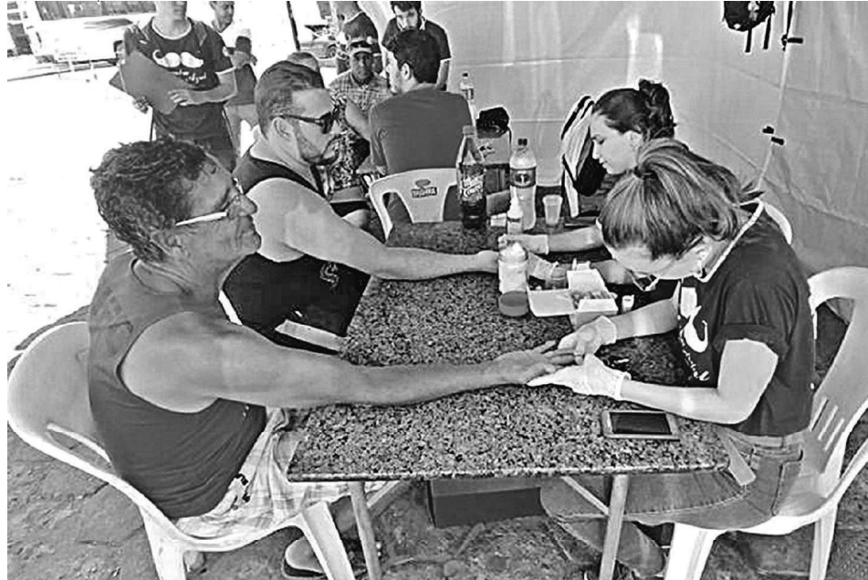
CONSCIENTIZAÇÃO - Unimontes atendeu várias pessoas em ação realizada em 2017; a deste ano é a quinta edição

Segundo a Sociedade Brasileira de Oncologia, os exames de prevenção devem ser feitos a partir dos 50 anos, para a população em geral, e a partir dos 45 anos para quem tem histórico familiar da doença.